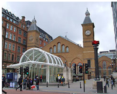
Krypten i Saint Paul's Cathedral og Liverpool Street Station.