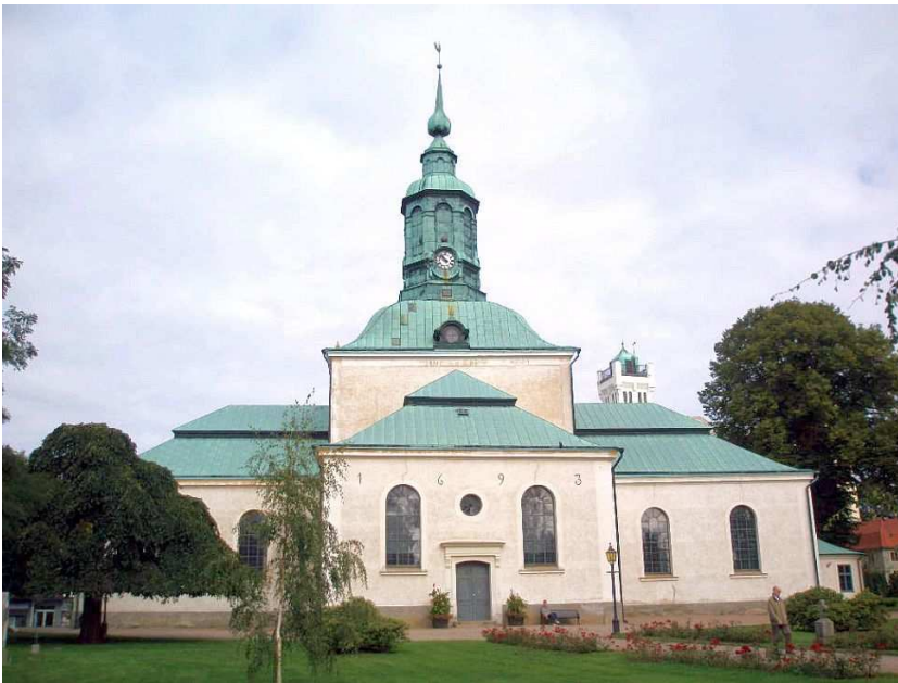
Karlshamn Kyrka - med den imponerende døbefont.