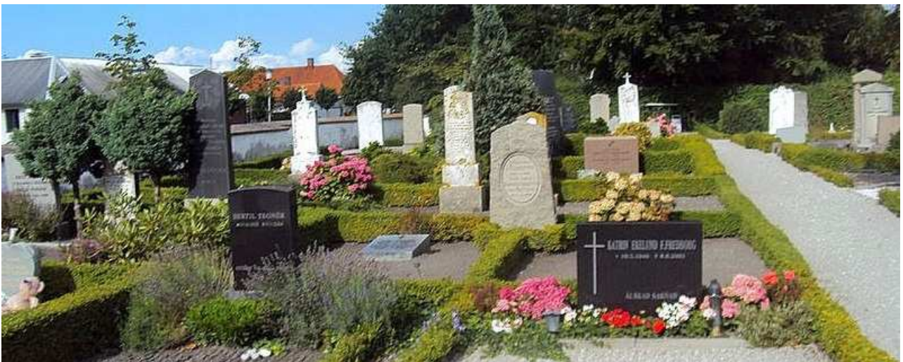
Den velplejede kirkegård