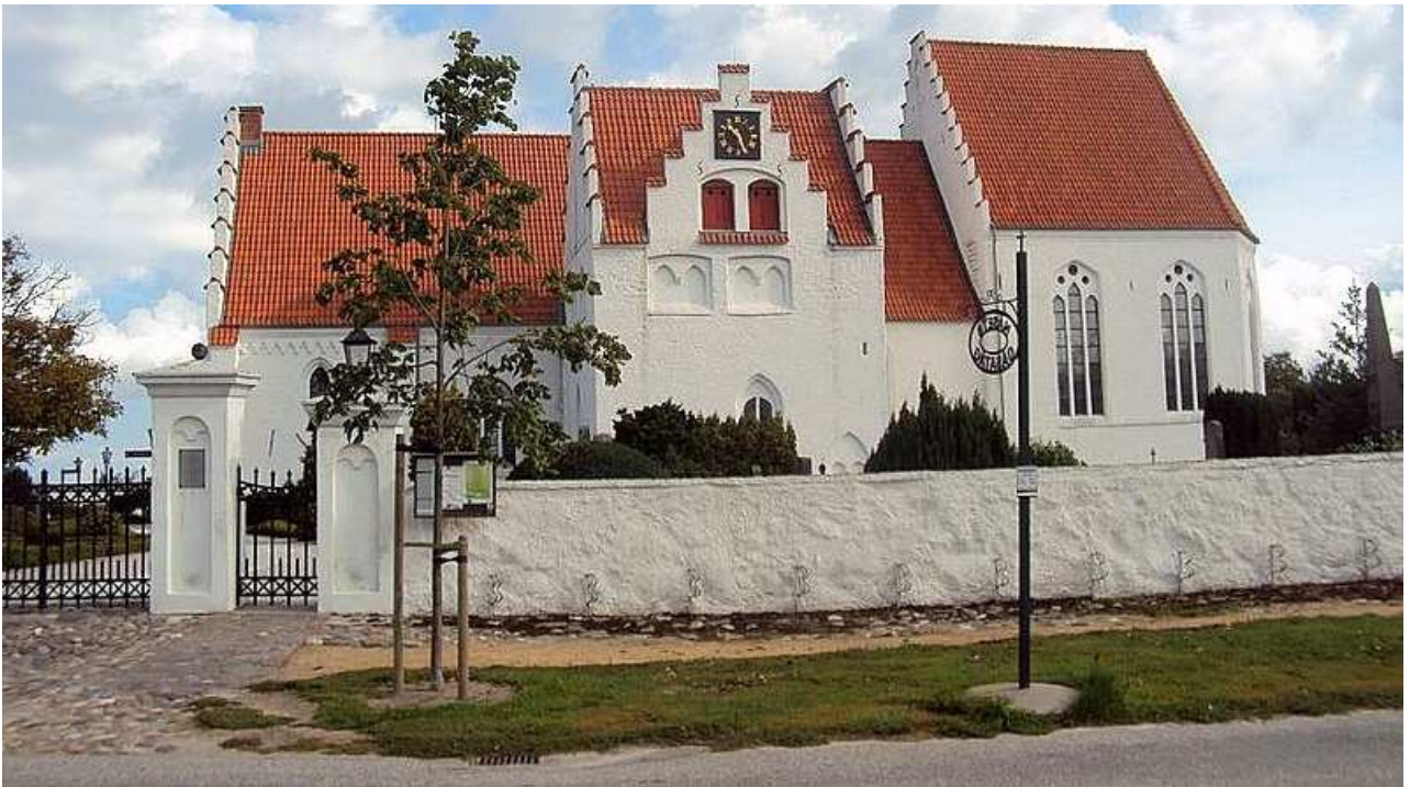
S:t Olofs Kyrka (Skanör Kyrka)