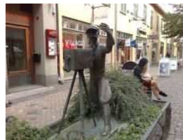
Kristianstad: Torvet t.v. Ved filmmuseet, gågaden.