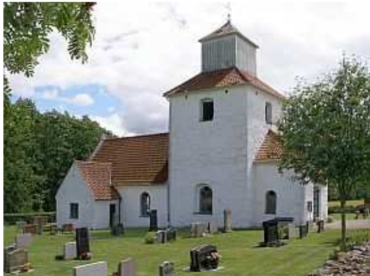
Ivö Kyrka – og kirkens alterparti tv.