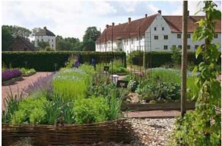
Tykarpsgrottan og Hovdala Slott.