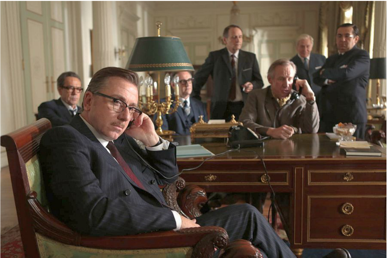
Fyrst Rainier (i forgrunden) og allierede står over for uhyrlige franske trusler Nedenfor: Grace Kelly bliver fyrstinde Grace og finder meningen med sit liv